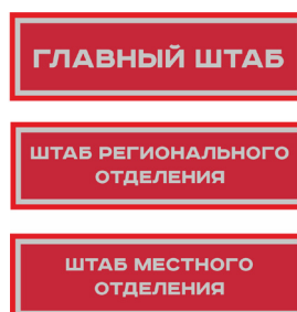
Нарукавный знак, устанавливающий принадлежность к структуре органов ВВПОД «ЮНАРМИЯ»